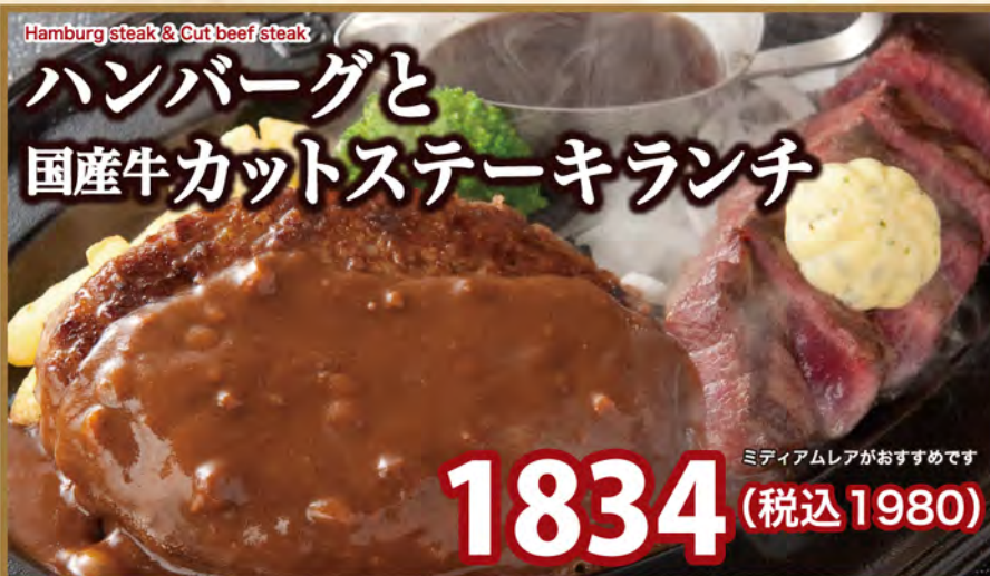
Hamburg steak & Cut beef steak