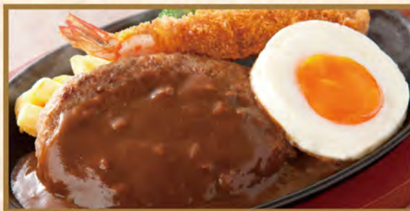
Mansei combination set