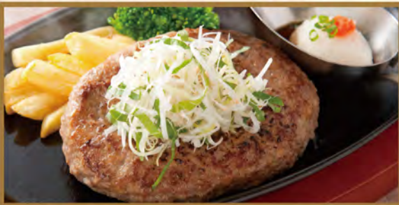
Hamburg steak Japanese style