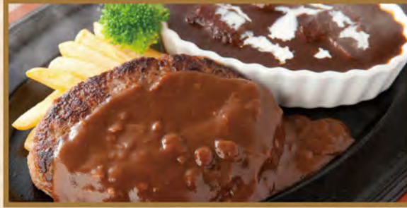
Hamburg steak & Beef stew