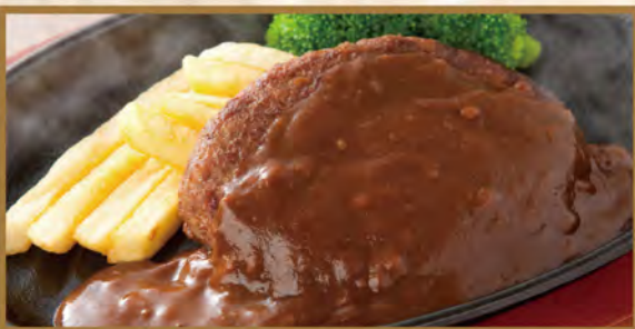
Hamburg steak (beef & pork) ハンバーグランチ

+160円 (税込172) でとん汁をポタージュに変更できます +160円 (税込172) でとん汁はおかわりできます