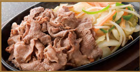
Wagyu beef teppan yaki