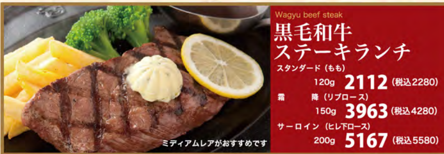
Wagyu beef steak