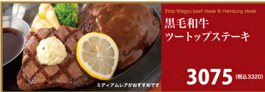
2top Wagyu beef steak & Hamburg steak