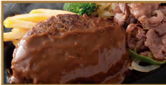
Hamburg steak & Wagyu Kalbi