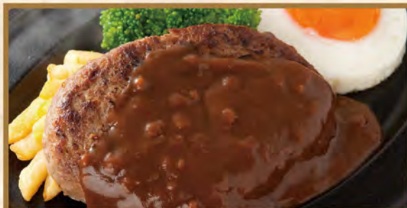
Hamburg steak with fried eggs