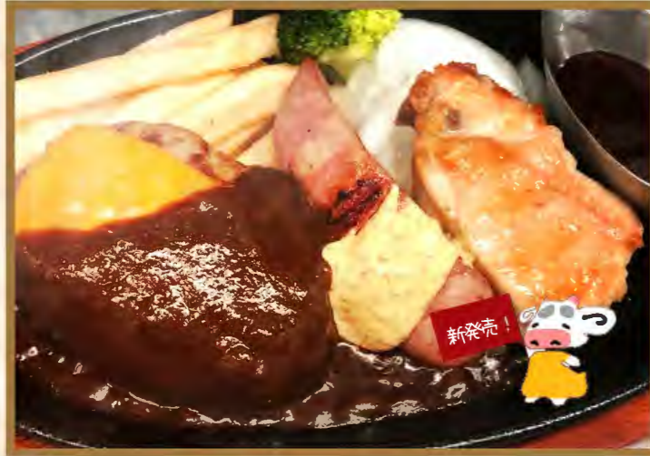
Mixed grill lunch