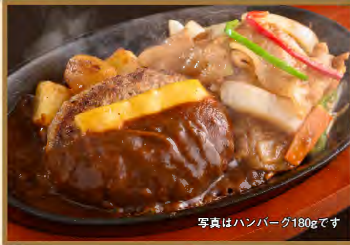
Hamburg steak & Fried pork with ginger

ハンバーグ120g 1720円 (税込1892円) ハンバーグ180g 1980円 (税込2178円)