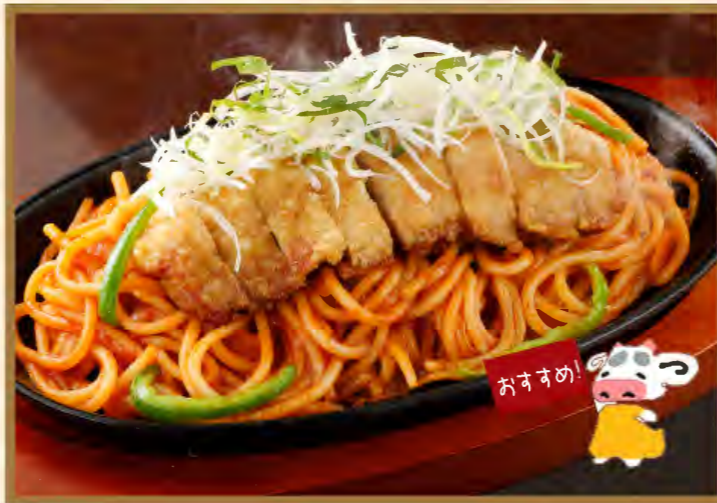
Deep fried pork & Spaghetti neapolitan

パーコーナポリタン 1150円 (税込1265円) ダブルパーコーナポリタン 1350円 (税込1485円)