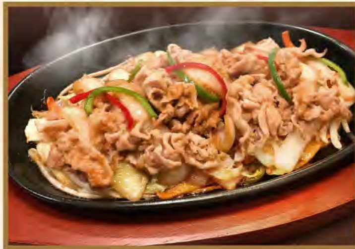
Fried pork with ginger

ロースとんかつ 120g 1150円 (税込1265円) ロースとんかつW 240g 1650円 (税込1815円) おろしポン酢追加 +190円 (税込209円)