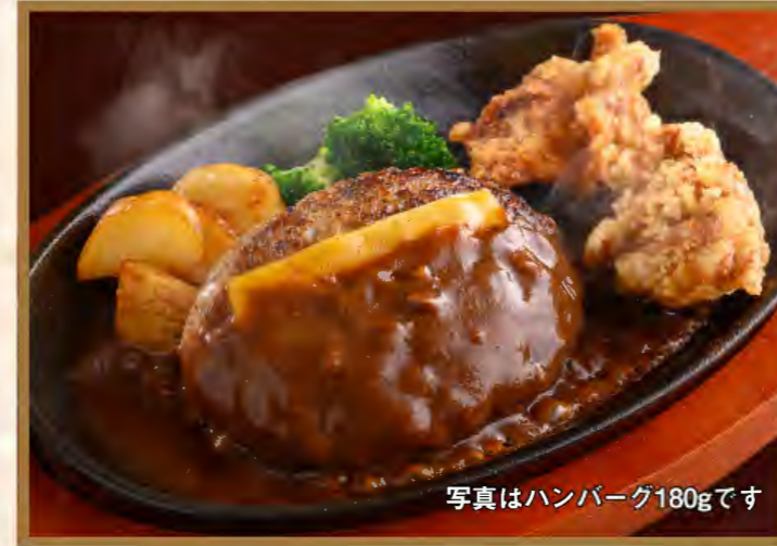
Hamburg steak & Deep fried chicken

ハンバーグ120g 1380円 (税込1518円) ハンバーグ180g 1640円 (税込1804円)