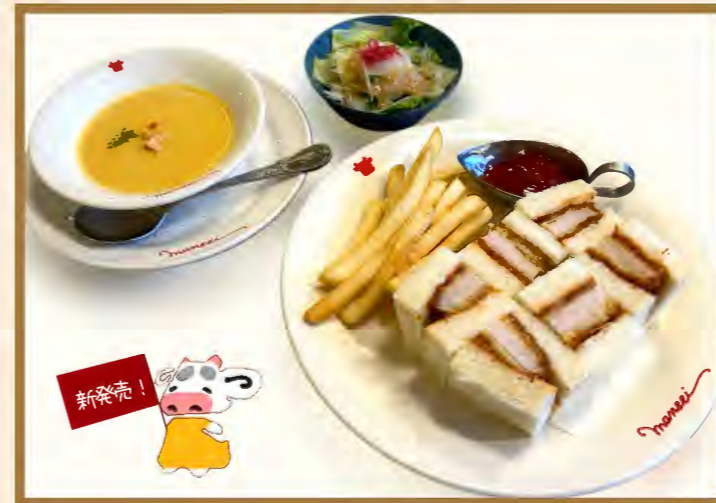
Pork cutlet sandwich lunch

ナポリタン大盛 +180円 (税込198円) ナポリタン特盛(サービス価格) +180円 (税込198円)