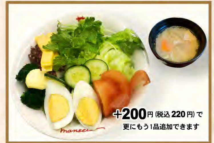
Combination Salad lunch